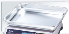
große Warenschale optional

Optionen: Blei-Gel-Akku (hohe Kapazität) 15,00 € | Arbeitsschutzhaube 10,90 € | Warenschale 350×300 mm 25,00 € | XL-Plattform 380×260 mm 39,00 € | RS-232-Schnittstelle 29,90 € | Transportkoffer mit Polsterung 99,00 € | Eichung 29,00 €